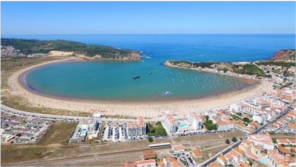
Parque Aquático insuflável de São Martinho do Porto e Gaivotas - 4K Ultra HD by Portugal visto do Ceu